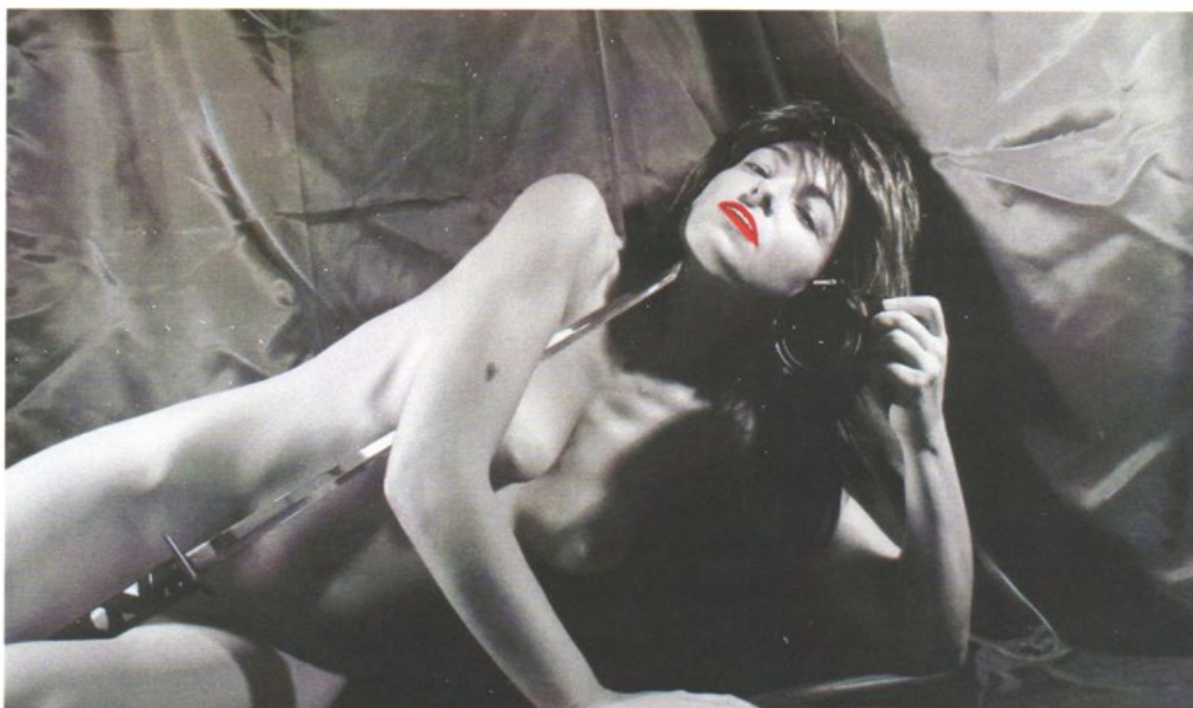
Autoritratto 4, 2011, cm 47x80