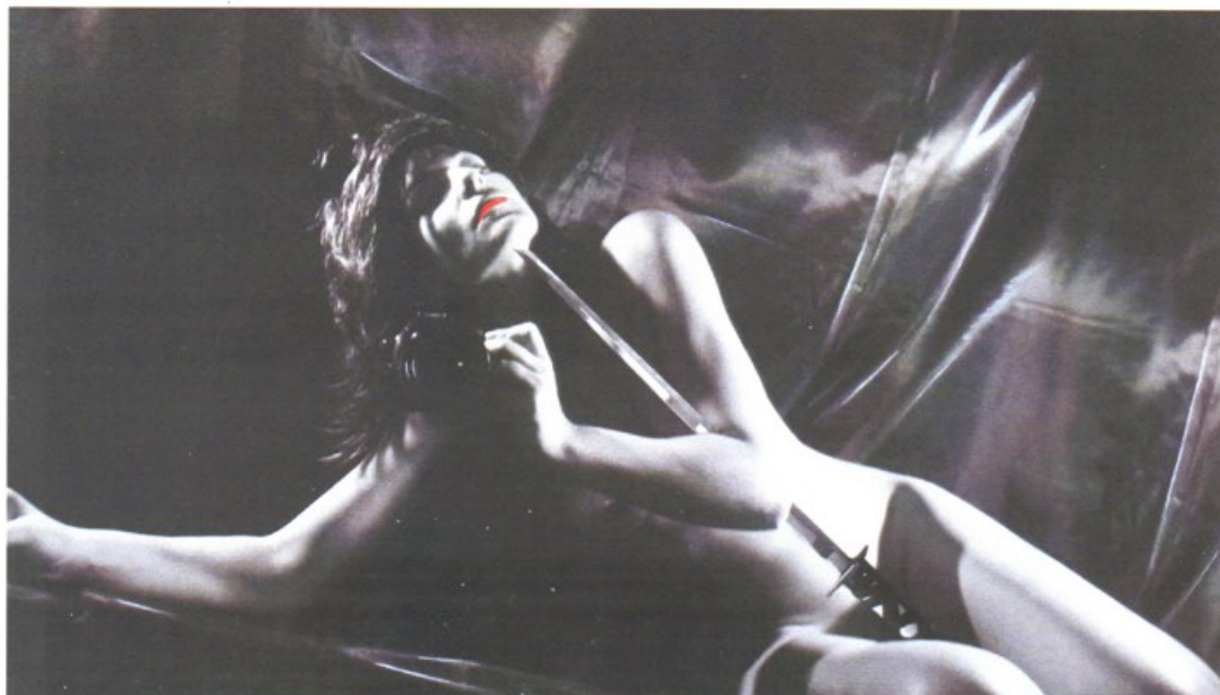
Autoritratto 6, 2011, cm 40x70